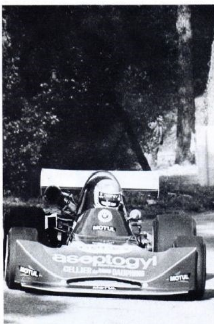
▲ Mieusset : à défaut d'un troisième titre, le Lyonnais se consolera avec la gloire et les primes !

En tourisme de série, c'est encore une BMW, la 30 CSI de Bever, qui s'imposait, alors que Porsche réalisait aussi le doublé avec la victoire, en Gr. III, d'une Carrera conduite par Claude Bering. F. Billet