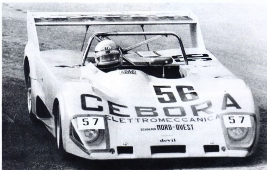
▲ Nesti : il lui faudra compter avec la Chevron de Pozet (second du Groupe à Ampus) mais aussi avec les Abarth-Osella, voire la Chevron B 26 à moteur Cosworth DFV d'Erís Tondelli.