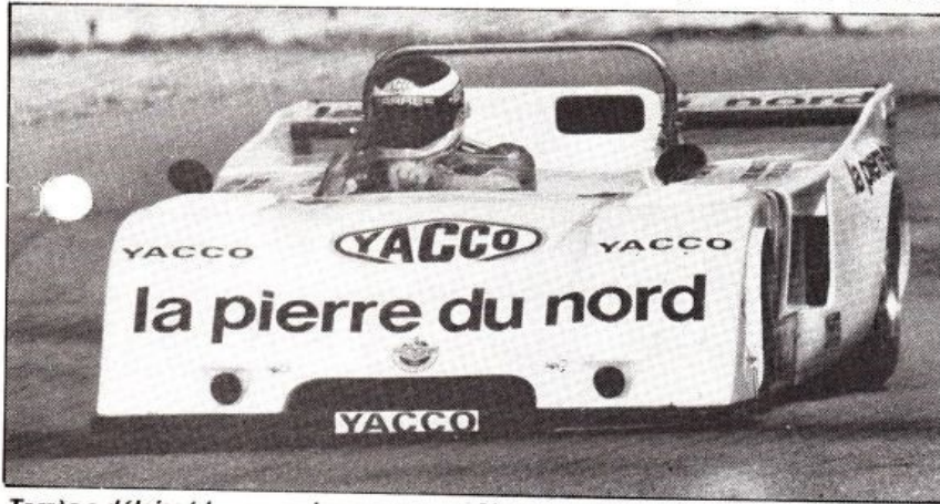
Tarres a délaissé la monoplace pour une Chevron 2 litres.