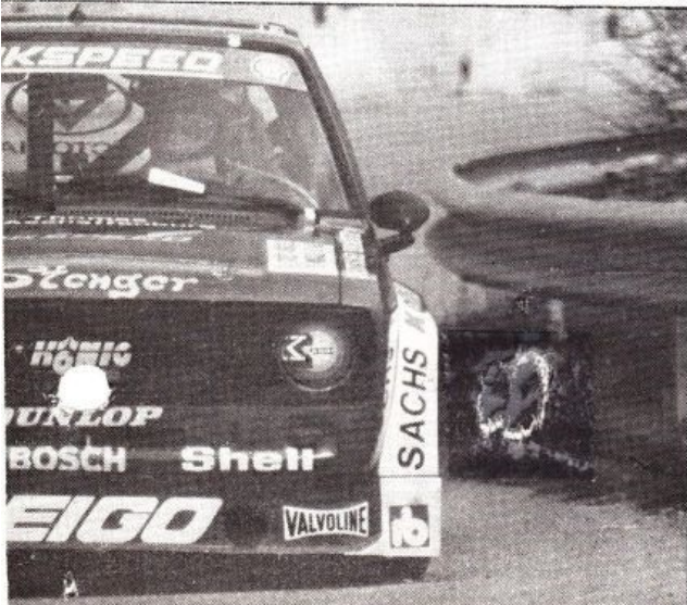
Stenger le champion d'Europe battu dans la seconde montée.