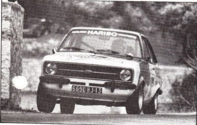
Vuillermoz le meilleur aux essais mais pas en course.