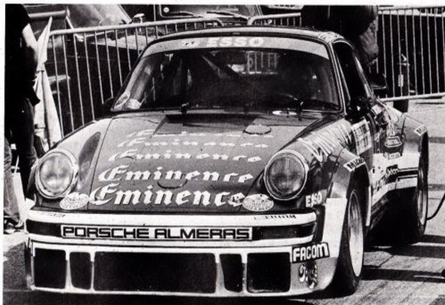
Les voitures restent identiques, mais on continue à gagner chez les Alméras.