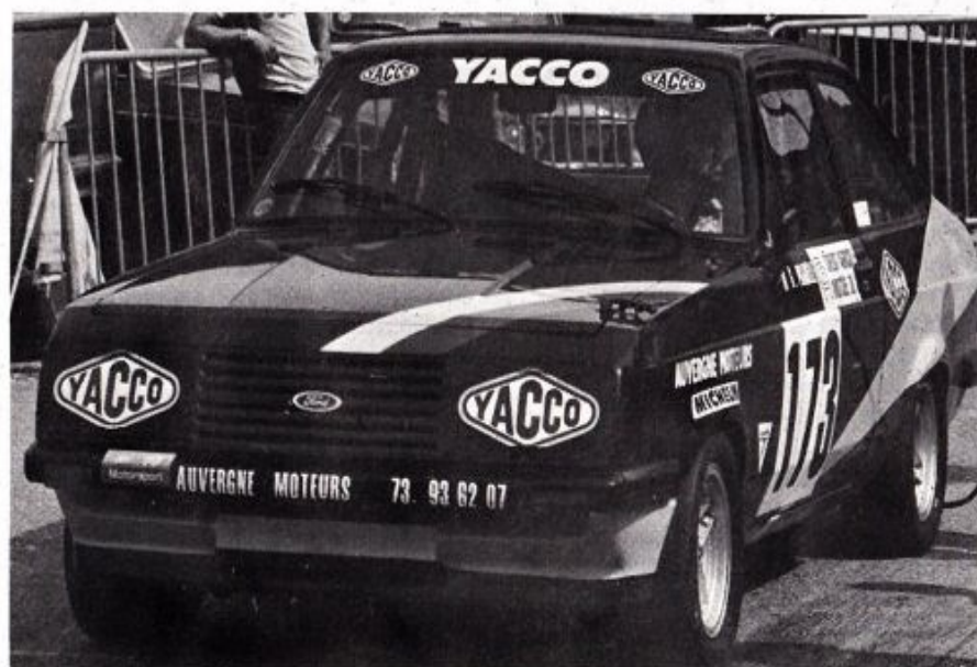
Gérard Pradelle en groupe 1 malgré la menace de Vuillermoz.