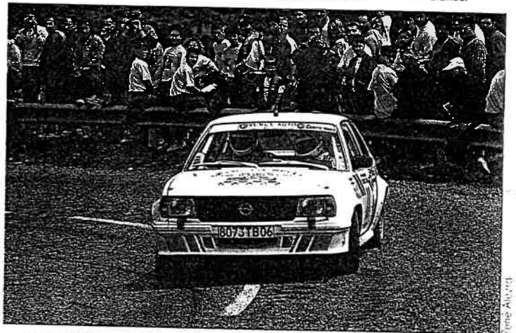
Trimatis toujours généreux dans l'attaque !