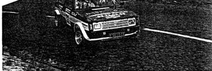
Pelosi et sa Lotus en slicks... pas même retailés.