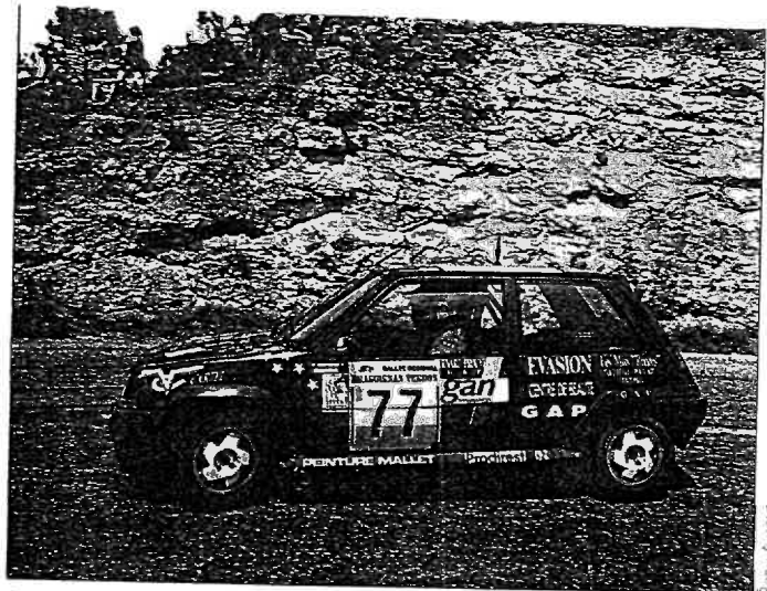
Guiramond, le meilleur des R5 GT Turbo, confirme sa belle course de la Durance.