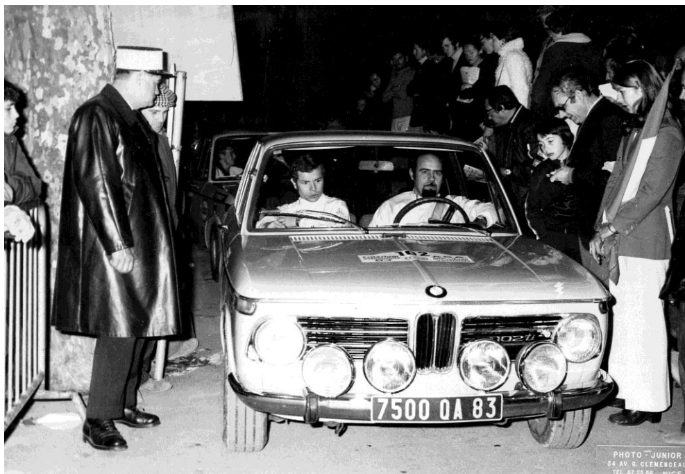
AUGIAS - PIVOT