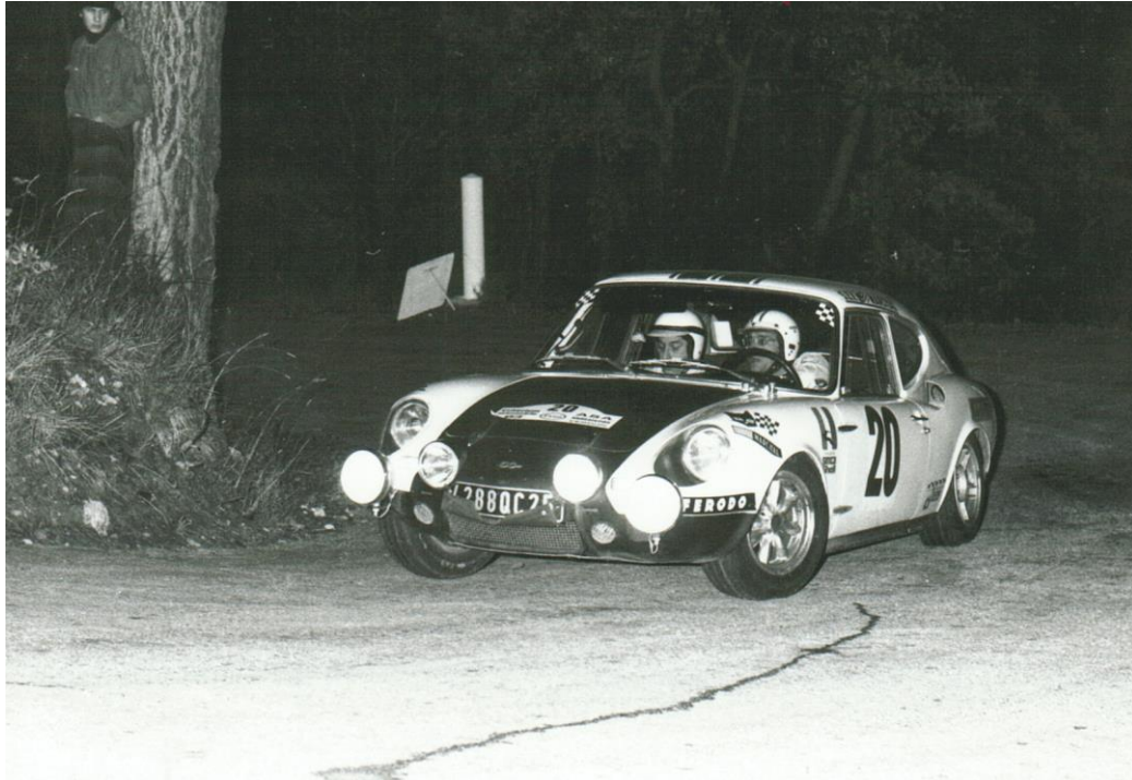
RENAUDAT – LENNE (Simca CG)