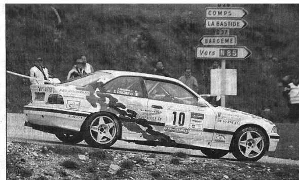
Pierre ESCUDERO – COLLOMP (BMW 325 IS)