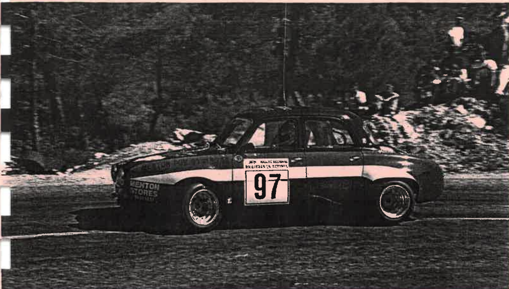
La vénérable Dauphine de Pasini, second en F12.