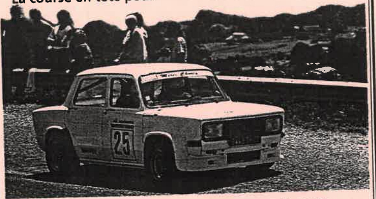
Draguignan-Verdon/Ligue Côte d'Azur/11e édition. Organisé par FASA Draguignan-Verdon.

La course en tête pour Polonio en 1300 Gr.F.