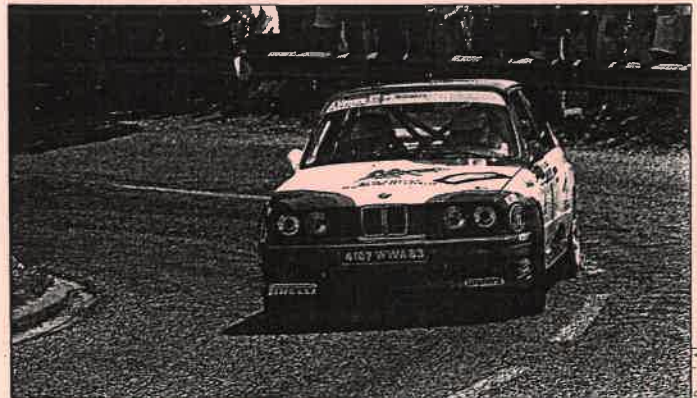
Cloître est resté en embuscade et dispose enfin d'une direction assistée efficace.