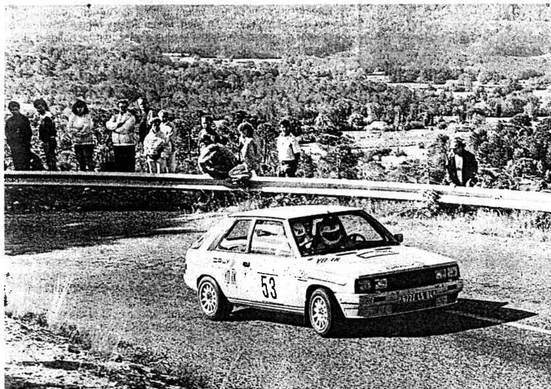
Un passage spectaculaire du côté de Villecroze.