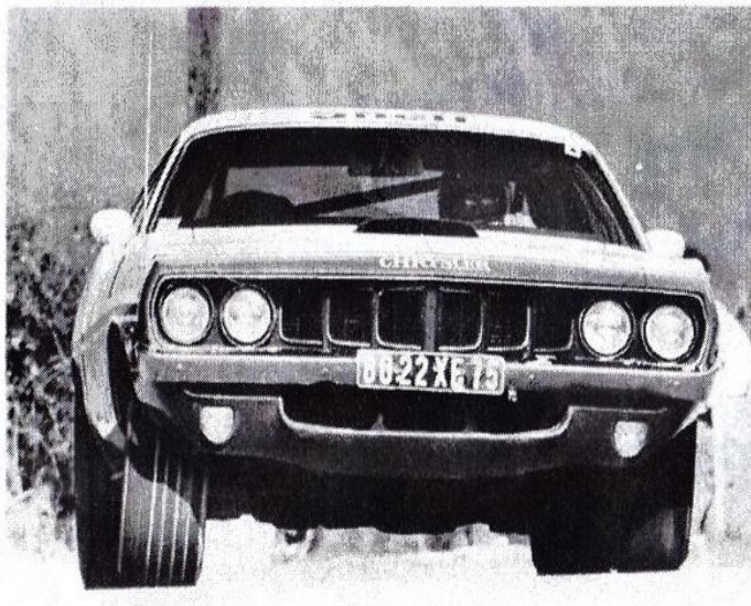
Geral et son Hemicuda: victoire de la cavalerie lourde.